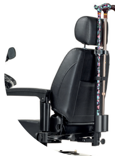
SW31 Uchwyt na kule