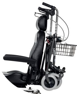
SW06 Uchwyć na balkonik