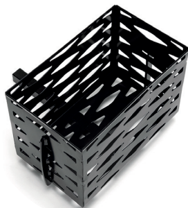
SW83 Uchwyć na butlę z tlenem