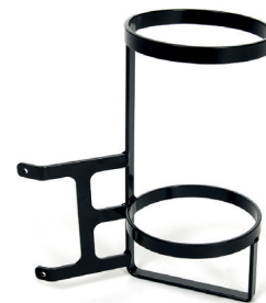
B83 Uchwyt na pojemnik z tlenem