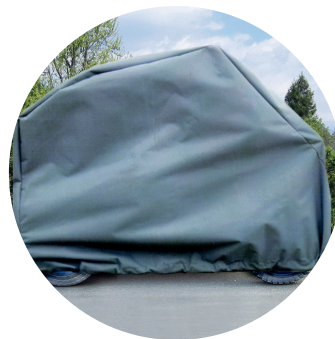
SH08 Pokrowiec na skuter